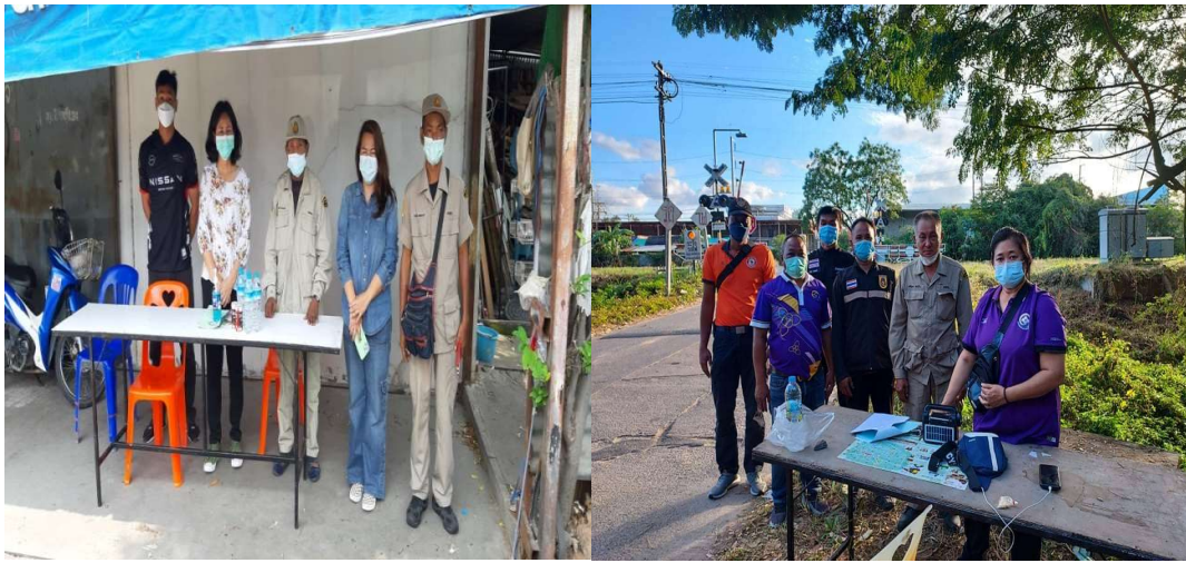
๖. หัวหน้าฝ่ายป้องกันฯ ได้ตรวจติดตามผลการปฏิบัติงานและตรวจเยี่ยมให้กำลังใจผู้ปฏิบัติงานตามจุดเสี่ยงต่าง ๆ