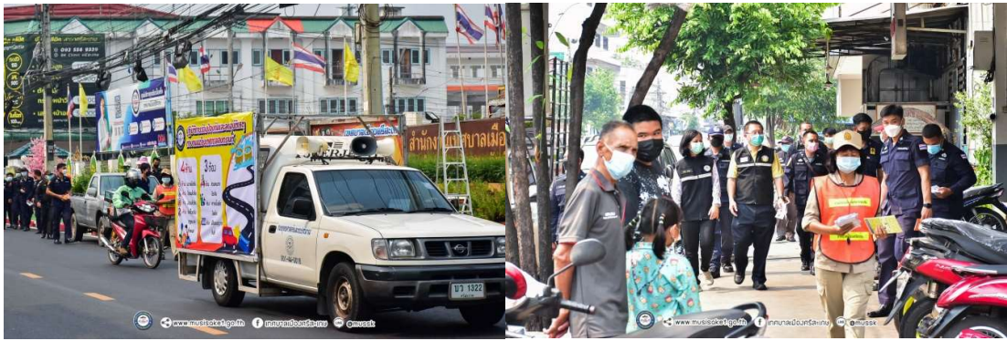
๕. จัดอาสาสมัคร อปพร. ผู้นำชุมชนมีส่วนร่วมในการป้องกัน การรณรงค์และลดอุบัติเหตุบนท้องถนน เฝ้าระวังจุดตัดทางรถไฟ ชุมชนพันทาน้อง ชุมชนพันทาใหญ่